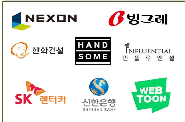
< 신규 광고주 : 본사 >