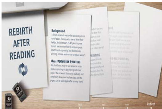
<Friends of Nature, Rebirth After Reading>